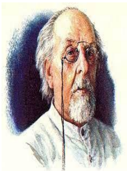
Константин Эдуардович Циолковский