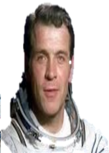
Александр Александрович Серебров лётчик – космонавт

Областной центр тесно связан с космонавтикой и ракетостроением.