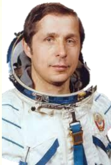
Виктор Петрович Савиных лётчик - космонавт