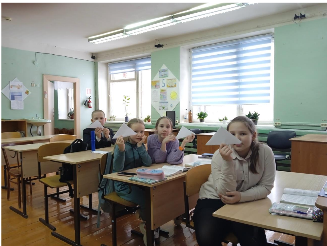
Итог мастер-класса, готовые письма